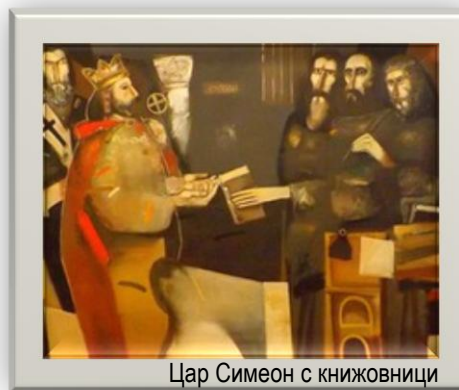
Цар Симеон с книжовници